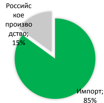
Структура импорта срезанных цветов в РФ в 2018*