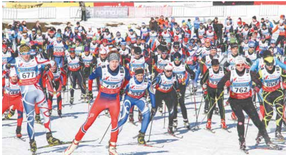
Старт гонке дан!

Второй день спортивного праздника начался со старта Деминского беби-марафона. Покорять почти километровую дистанцию приехали 105 юных лыжников, самому младшему из которых исполнилось