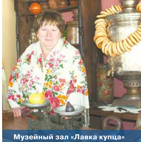
Музейный зал «Лавка купца»

О том, что у города есть реальное будущее в плане развития туристической сферы, говорит статистика посещаемости Тутаева туристами. Если в 2003 году у местного причала останавливалось меньше десятка туристических теплоходов, то сейчас их число приближается к сотне.