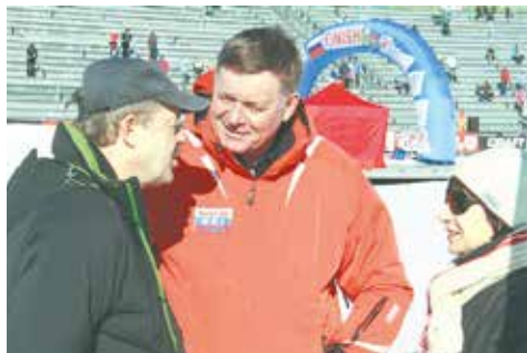
Главы болеют за марафонцев!

14 – 15 марта под Рыбинском состоялся VIII Деминский лыжный марафон элитной серии Worldloppet.