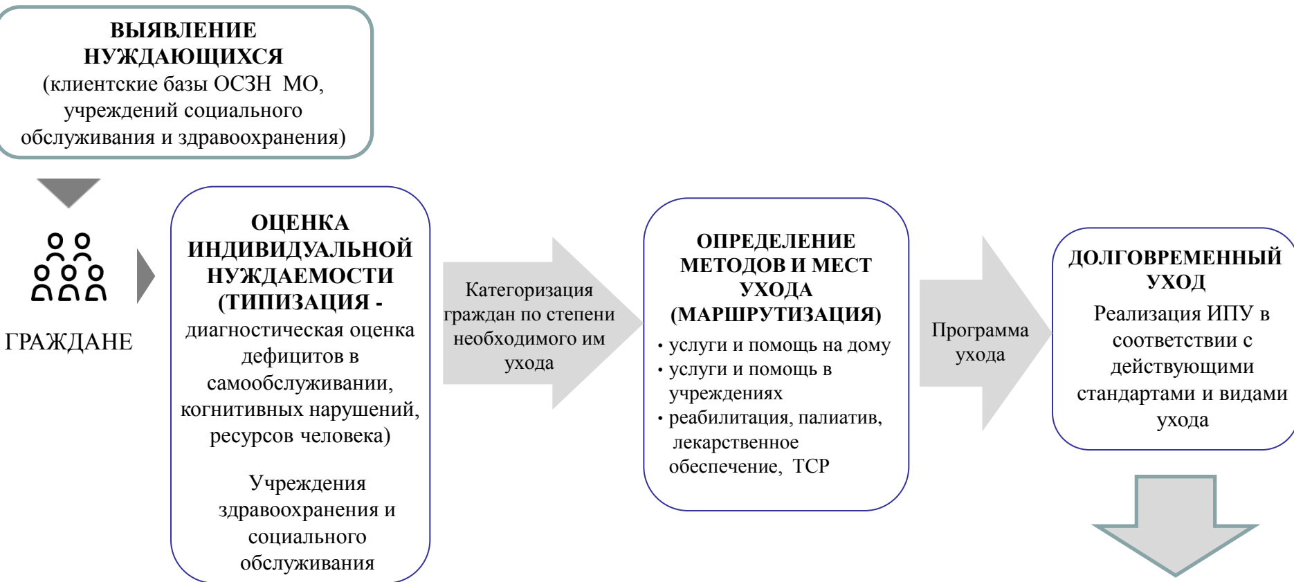
Схема функционирования Системы долговременного ухода